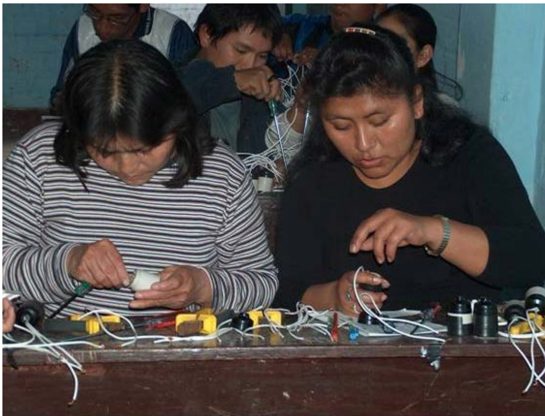
Aprender con la acción es el principio rector del aprendizaje significativo.

En este apartado nos detendremos a revisar brevemente el significado de algunos términos que a veces se utilizan indistintamente ( cambio, mejora e innovación ) y que, sin embargo, conviene diferenciar. En segundo lugar, analizaremos lo que podríamos llamar la « naturaleza » del cambio, como contenido y proceso que subyace a las otras transformaciones (mejora escolar, innovación didáctica). En tercer término, pondremos atención a la importante tarea de revisar algunas condiciones para iniciar, desarrollar y sostener estos procesos.