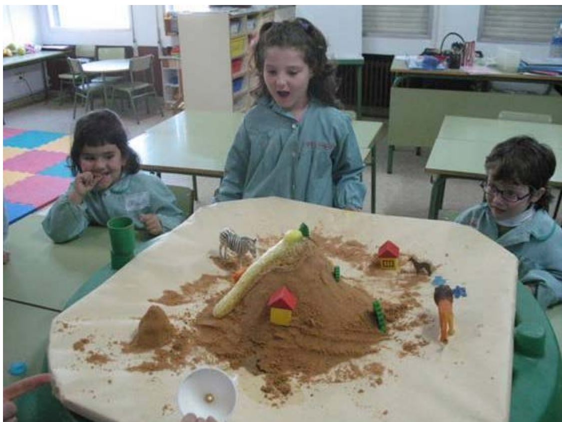
El cambio implica necesariamente modificar rutinas metodológicas. En la imagen, taller en un aula de infantil sobre la erupción de los volcanes.

El cambio es aprendizaje , en el sentido de que cambiar entraña, básicamente, el aprendizaje de nuevas formas de pensar y de actuar. Si comprendemos y aceptamos esta premisa tendremos mucho conseguido para cuando tratemos de entender cómo afrontar un cambio, pues el análisis de lo que ya sabemos sobre el aprendizaje escolar nos aportará ideas provechosas. Dicho en otros términos, las circunstancias que favorecen (o en su caso dificultan) el aprendizaje, son las mismas que debemos aplicar (o evitar), para intentar introducir cambios que afecten a nuestro trabajo.