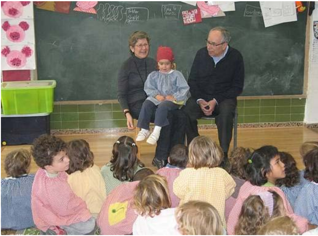
La comunidad educativa en su conjunto constituye la unidad de cambio si todos sus miembros forman parte del proyecto de la escuela. En la imagen, unos abuelos narran un cuento en un aula de infantil.

El centro es una unidad de transformación social y cultural si abre sus puertas al entorno y si invita a su comunidad a formar parte del proyecto de escuela. En consonancia con lo anterior se deben establecer cauces de participación con toda la comunidad educativa (familias, alumnos, profesores, asociaciones) que permitan delimitar unas finalidades educativas y un modelo de gestión del centro acordes con el compromiso de valores inclusivos que vimos en el primer módulo de este curso.