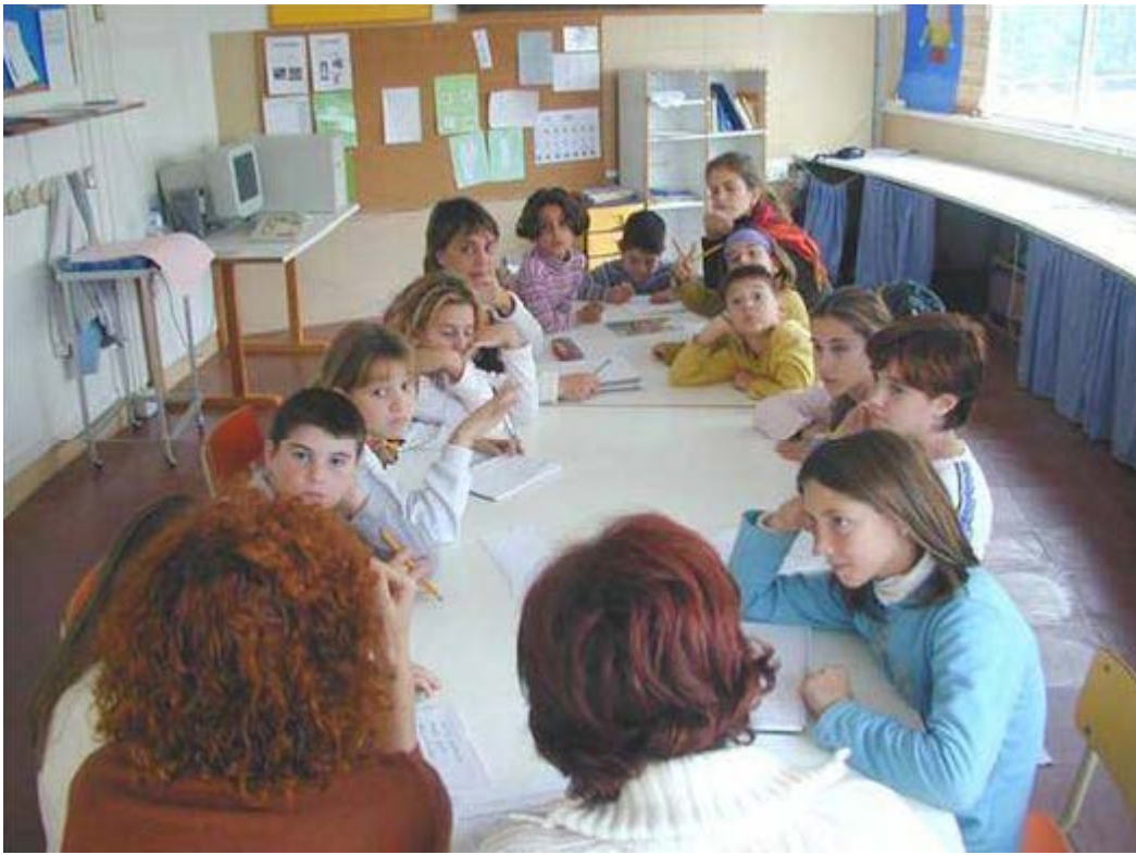
Resulta mucho más efectivo introducir los cambios contando con la opinión de alumnos y alumnas. En la imagen, reunión de uno de los órganos de participación del alumnado en el centro Escuela 2 (Valencia).

Los centros educativos tienen que planificar tanto en sus estructuras de coordinación y directivas, como en su currículo educativo, acciones y planes concretos para responder a todos sus alumnos con excelencia y equidad. Para ello habrá que introducir objetivos del tipo: