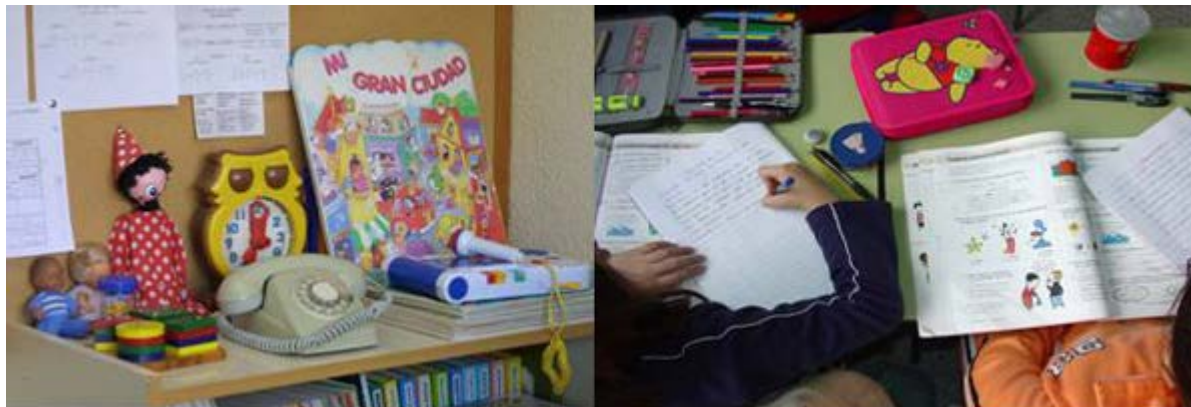
Los libros de texto son una ayuda didáctica para el profesor pero nunca puede ser la única.

Para hacer realidad un currículo de este tipo, éste debe alejarse de los planteamientos prescriptivos y rígidos, centrados en muchas ocasiones exclusivamente en el libro de texto.