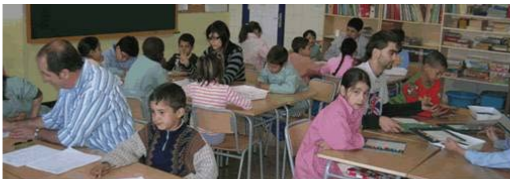
Distribución de un aula con varios grupos interactivos.