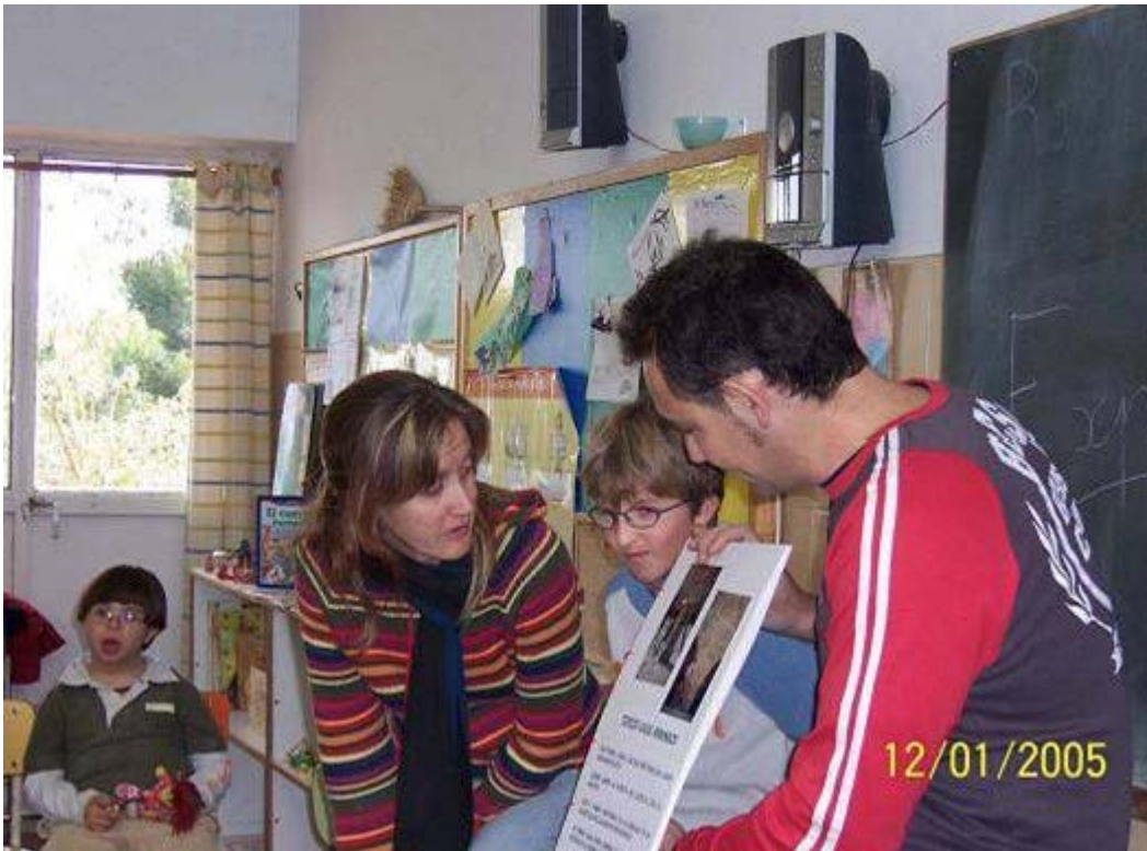
Los docentes tienen que seleccionar los procedimientos de evaluación más adecuados para cada contenido.

Entre los criterios que pueden guiarnos en el diseño de la evaluación se encontrarían: