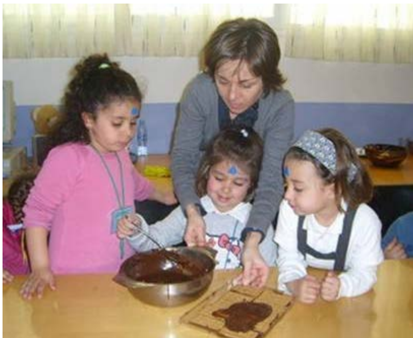
Hay que tener en cuenta las diversas formas de agrupamiento en función de los objetivos. En la imagen, una madre y tres alumnas participan en un taller de cocina.

tareas individuales, investigación en laboratorio, trabajo de biblioteca o de actividades en pequeños grupos para desarrollar la unidad didáctica iniciada con la actividad de gran grupo. En los agrupamientos flexibles los alumnos se relacionan y, además, trabajan a su propio ritmo de aprendizaje, así los alumnos se juntan para realizar una actividad determinada sin necesidad de pertenecer a un mismo nivel educativo. De esta forma se favorecen la comunicación y las relaciones interpersonales, lo que genera un clima de participación que facilita dinámicas de trabajo dentro del mismo grupo.